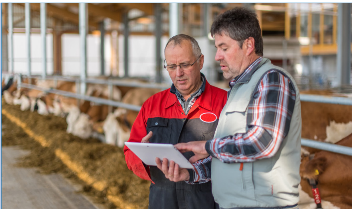
Viele Landwirte spüren die wirtschaftlichen Folgen der Corona-Pandemie. Das vom Gesetzgeber beschlossene dritte Corona-Hilfspaket erwähnt nun erstmals auch ausdrücklich Land- und Forstwirte als Anspruchsberechtigte.

Ihre Landwirtschaftliche Buchstelle informiert Sie gerne und im Detail über Ihre steuerlichen Gestaltungsmöglichkeiten.